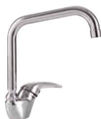
rubinetto Pains modello Mini cromo cod. 448080107000 € 62,00