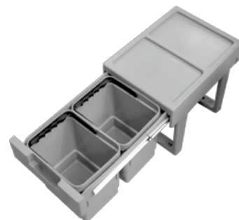
cod. PLESAMP 2 € 55,00