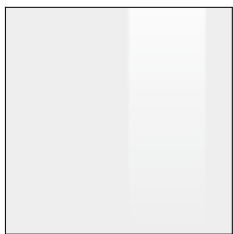
bianco lucido liscio